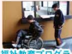
福祉教育プログラム