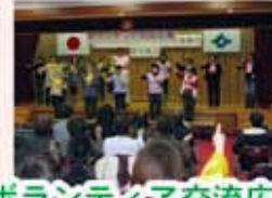
ボランティア交流広場