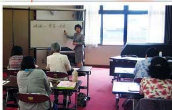
6/25 第1回「良い聴き手になるために～傾聴の基本～」

高齢者の孤独感や不安感を少しでもやわらげるお手伝いをするのが、この「お話し相手ボランティア」です。まだまだ馴染みが薄いかもしれませんが、お話し相手ボランティアを必要とされる方が身近においでましたら、一度かほく市社会福祉協議会までご相談ください。