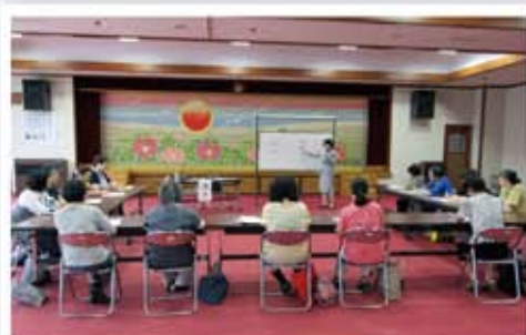
6/29 第1回「良い聴き手になるために～傾聴の基本～」