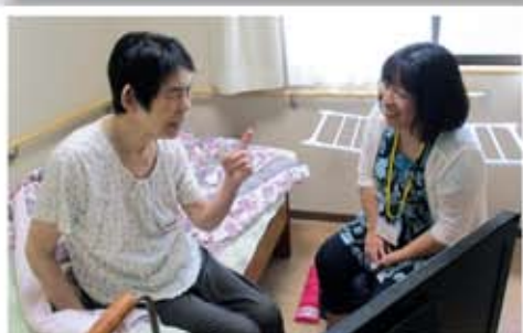
お話し相手ボランティア活動風景 (市内グループホームにて)

高齢者の孤独感や不安をやわらげるお手伝いをするのが、この「お話し相手ボランティア」です。