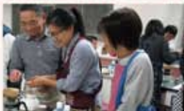
ボランティア入門講座