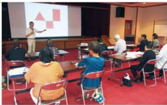
6/21 第1回 「コミュニケーション講座」