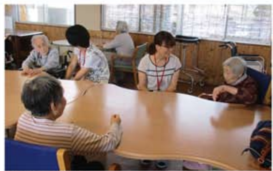
7/12 第4回 お話し相手ボランティア活動風景