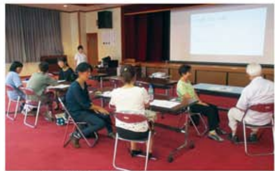
6/28 第2回 「認知症高齢者の支援について」