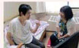
ボランティア養成講座