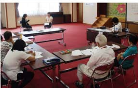
7/5 第3回 「良い聴き手になる ために～傾聴の基本～」