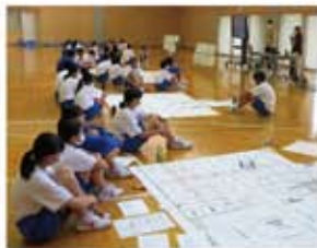
避難所運営ゲームHUG