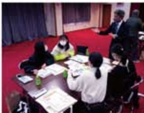
高校生ボランティア（研修）