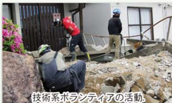
技術系ボランティアの活動