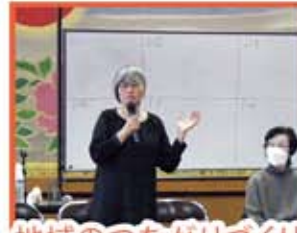
地域のつながりづくり ヒント講座