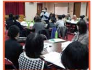
ボランティア交流広場