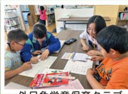
外日角学童保育クラブ

私たち「myan」は現在17人で活動をしています。主に、あいさつ運動や外日角学童保育クラブ、放課後児童デイチェンジAなどでボランティア活動をしています。これからも地域の方々のために、積極的に楽しくボランティアをがんばっていきましょうと思います。