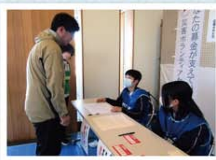
かほく市災害ボランティアセンター

私たち「助け隊」は様々な活動を通して地域の方々を笑顔にすることを目標にボランティア活動をしています。能登半島地震の影響で納得のいく活動ができない中でも自分たちに何ができるかを考え、行動をしてきました。みなさんからの活動依頼お待ちしております！