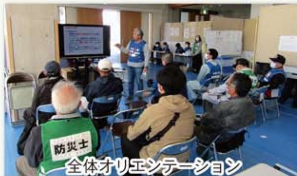
全体オリエンテーション