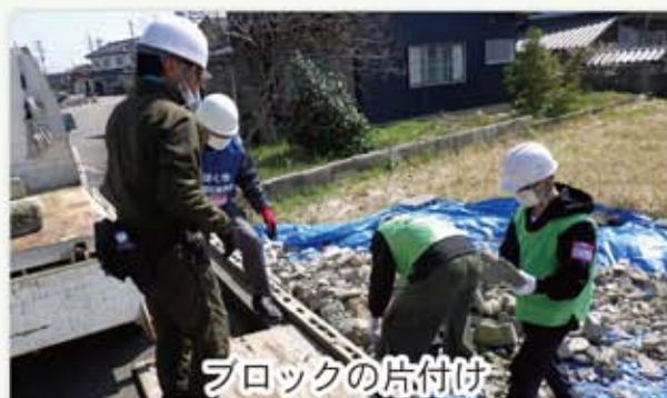
ブロックの片付け