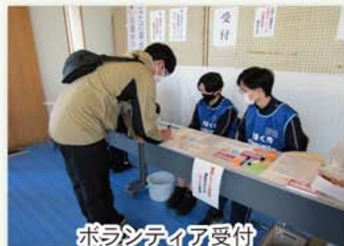
ボランティア受付