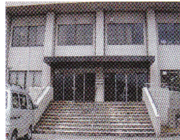
かほく市高松ク40番地 (高松社会福祉センター内)