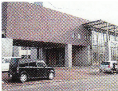
かほく市宇野気二71番地2 (宇ノ気保健福祉センター内)