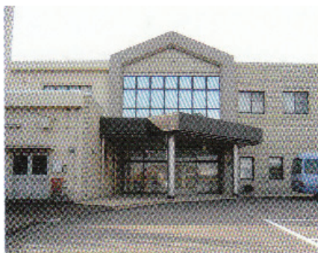
かほく市遠塚口52番地10 (七塚健康福祉センター内)